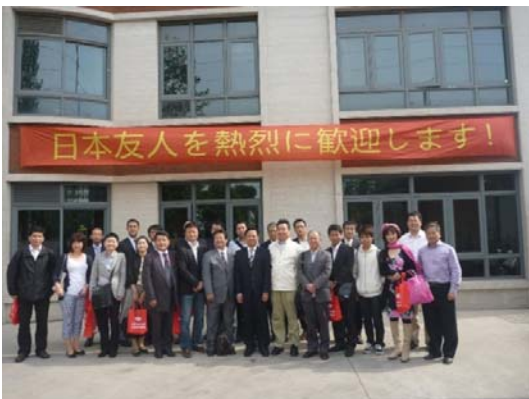
老人ホーム・病院見学ツアー①