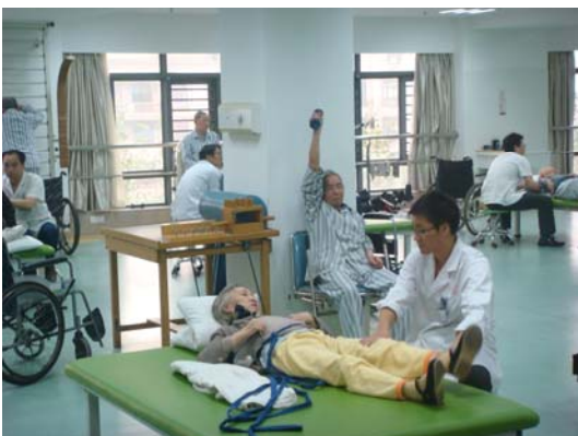
病院内リハビリ風景