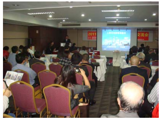
交流会講演の様子