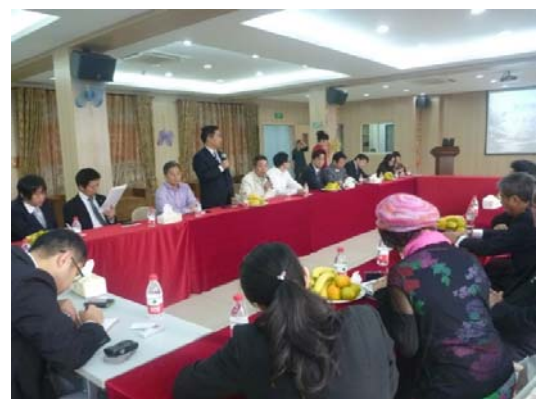
老人ホーム・病院見学ツアー意見交換会