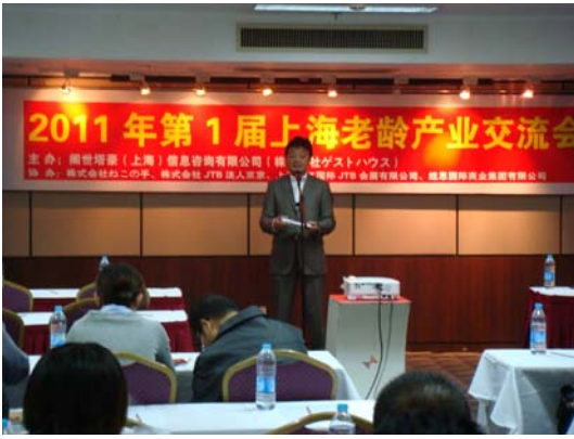
第1回上海老龄产业交流会 主催者挨拶